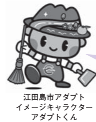
江田島市アダプトイメージキャラクター アダプトくん

江田島市では、平成26年度より新たに3団体加わり、市内各地で子どもから大人まで27団体、総勢約1400人を超える方々が、市道・河川の清掃・緑化・草刈などの活動を行っています。これからも多くの方々の参加をお待ちしております。