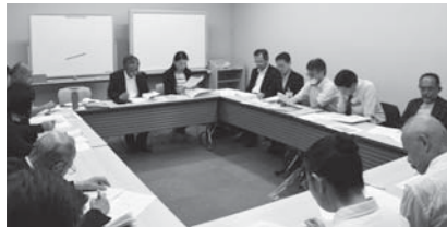
▼5月26日に開催された総会の様子

活動実績報告の提出準備に入っている団体もあると思いますが、報告書には活動写真・領収書の写し又は支払証明書・代表者捺印などが必要です。奨励金募集要項をよく読み、申請書などに記入漏れがないよう、ご協力をお願いいたします。